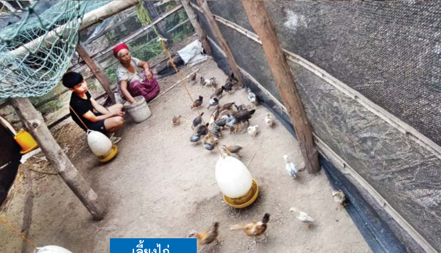
เลี้ยงไก่