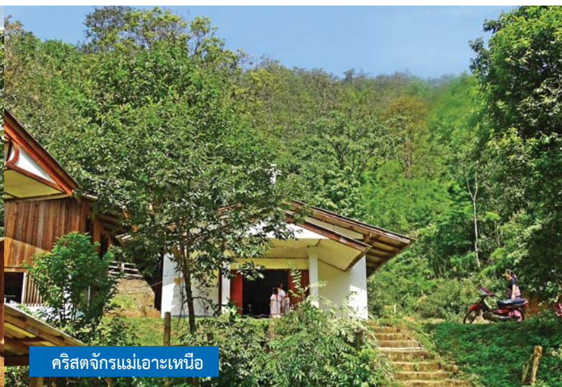
คริสตจักรแม่เมาะเหนือ