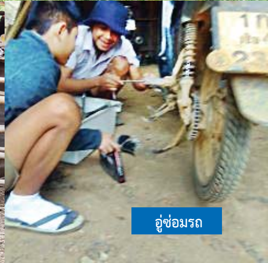
อยู่ซ่อมรถ