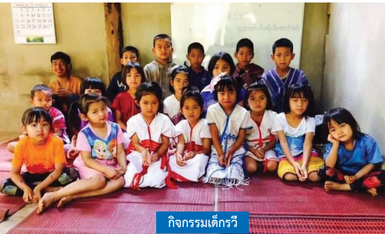
กิจกรรมเด็กกรี