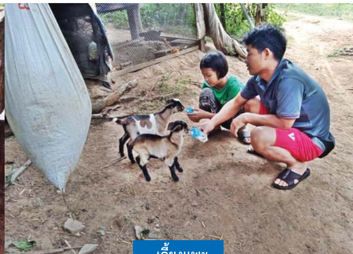
เลี้ยงแพะ