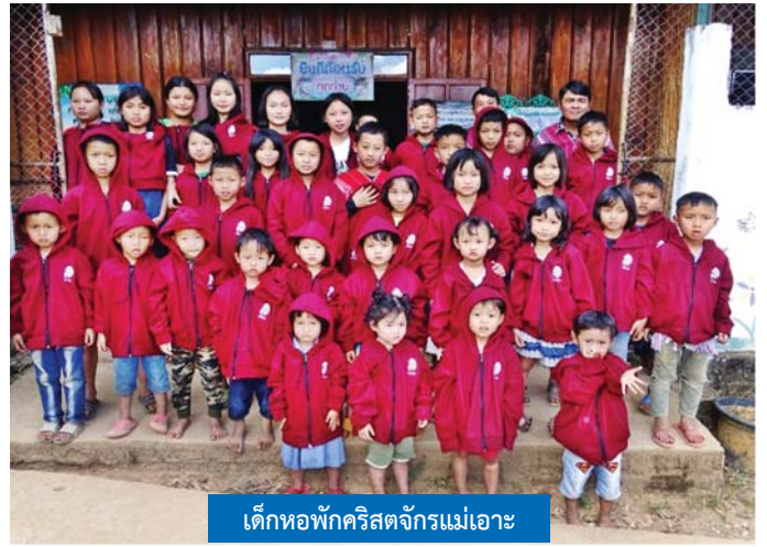
เด็กหอพักคริสตจักรแม่เมาะ

ตลอดระยะเวลา 22 ปี ในการเป็นคู่มือกับคอมแพสชั่น คริสตจักรได้มีการขยายพันธกิจพัฒนาเด็กแบบองค์รวมไปยังหมวดคริสตจักร 5 แห่ง ซึ่งปัจจุบันทั้ง 5 แห่ง ได้รับการสถาปนาเป็นคริสตจักร ได้แก่ คริสตจักรแม่สะงะ คริสตจักรแม่เมาะได้ คริสตจักรสบบอ คริสตจักรแม่ขอ และคริสตจักรแม่แจ้ มีจุดประกาศ 7 แห่ง ผ่านโปรแกรมการพัฒนาเด็กแบบองค์รวม