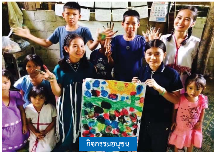
กิจกรรมอนุชน