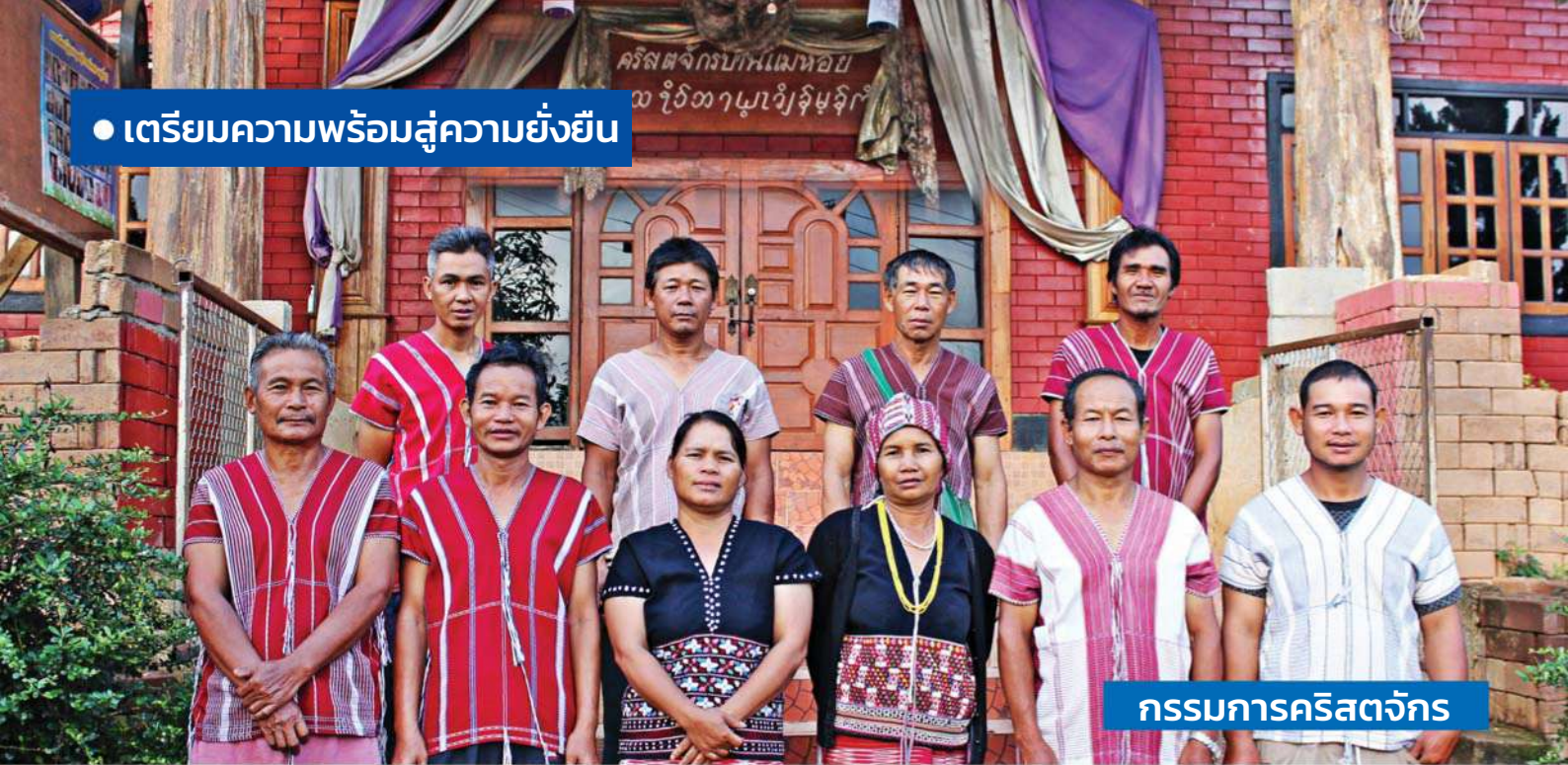
กรรมการคริสตจักร