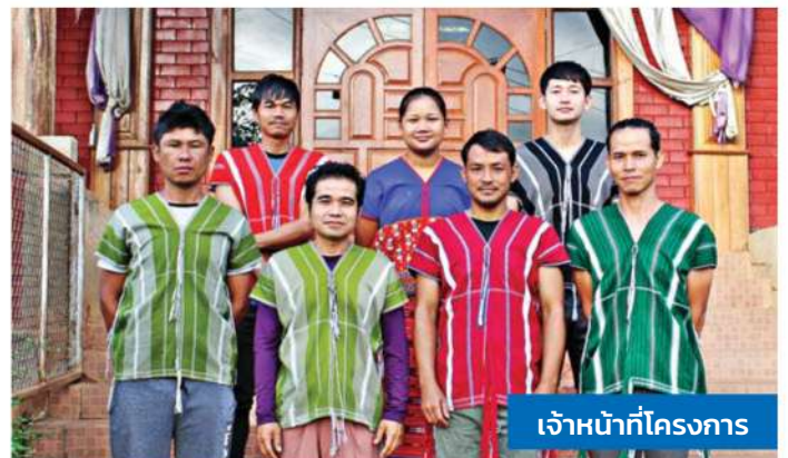
เจ้าหน้าที่โครงการ

คริสตจักรแม่หอยตั้งอยู่ในป่าเขาของอำเภอแม่แจ่ม จังหวัดเชียงใหม่ ประเทศไทย บริเวณโดยรอบล้อมด้วยภูเขาสลับซับซ้อน ระยะทางห่างจากตัวเมืองเชียงใหม่ 200 กว่ากิโลเมตร ปัจจุบันมีถนนลาดยางให้เดินทางผ่านตามความลาดชันของภูเขา ผู้คนในพื้นที่ดำเนินชีวิตตามวัฒนธรรมของชนเผ่ากะเหรี่ยง งานหลักคือทำการเกษตรเพื่อสร้างแหล่งอาหารเอง มีอาชีพเสริมคือปลูกข้าวโพดและทำปศุสัตว์เพื่อหารายได้